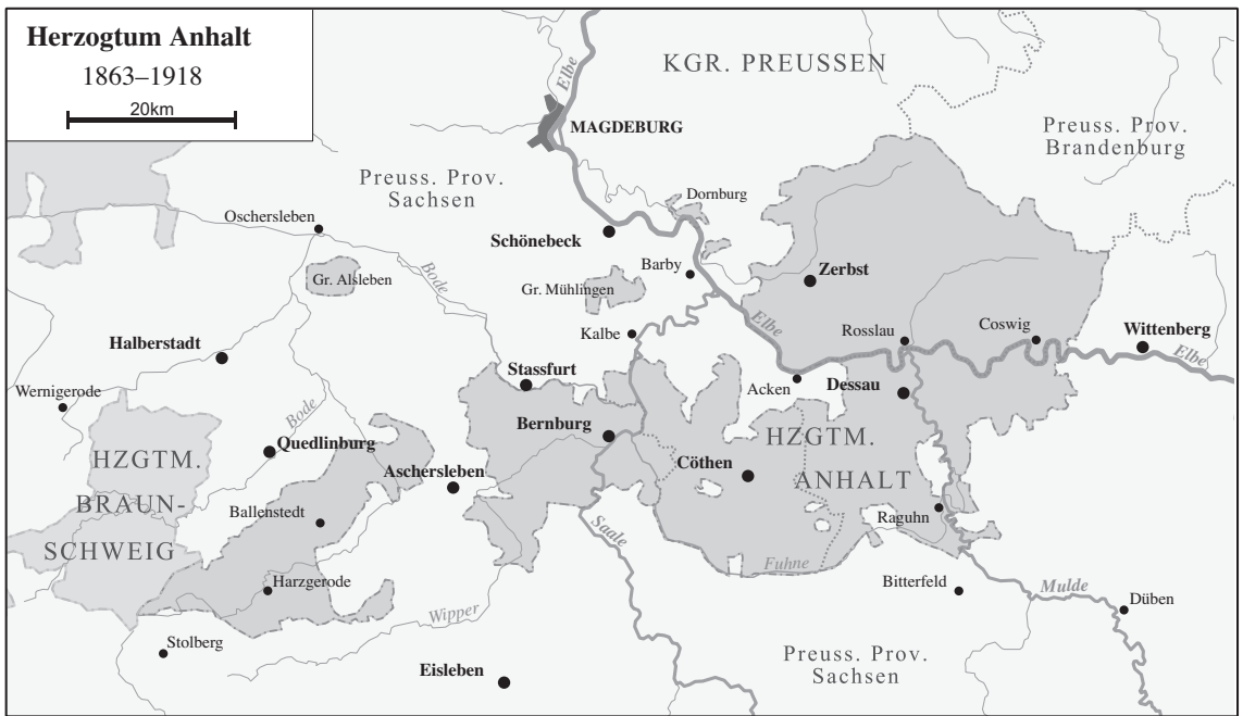
Urheber: Wikipedia: Alexrk

Wappen (1689): 1. Hzm. Sachsen, 2. Pfgft. Sachsen, 3. Hzm. Engern, 4. Geschlecht der Bäringer (Beringer). Bevorzugtes Münzbild und Staatseblem von Anhalt-Bernburg, 5. Stammwappen und kleines Staatswappen: Mgtf. Brandenburg/Hzm. Sachsen, 6. H. Ballenstedt, 7. Gft. Askanien, 8. Gft. Waldersee, 9. Gft. Warmisdorf, 10. Gft. Mühlingen, 11. Regalienschild, 12. H. Bernburg.